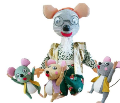
さんこう げきだん (参考：劇団ぱれっとホームページ)

どこからか、あの歌が聞こえてきます！ さて、穴の中には一体誰がいるんでしょうか？ そして、正べえさんはどうなるのでしょうか？ 乞うご期待！！