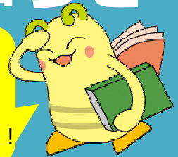
大分市民図書館キャラクター どくしん