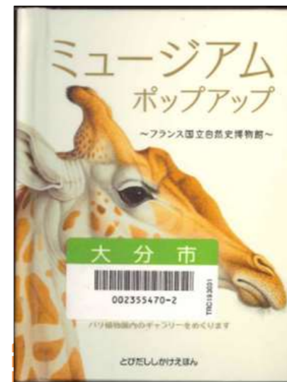
『ミュージアムポップアップ ~フランス国立自然史博物館~』 アンヌ=フロランス・ルマソン/文 ドミニク・エルハルト/絵 瀧下哉代(トランネット)/訳 〔大日本絵画〕