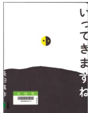
『いってきますね』 長田 真作/著 〔東急エージェンシー〕

「いってきますね」から「おかえり」までの間、カラフルでふしぎな世界を旅して、君は何を感じる？ 「トントン」「ポーン」「ファサファサ」など、リズムカルで言いたくなる擬音がいっぱいなので、声に出して読む楽しさもありますよ。