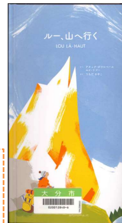
『ルー、山へ行く』 アヌック・ボワロベール ルイ・リゴール/作 内田沙矢子/訳 〔アノニマ・スタジオ〕