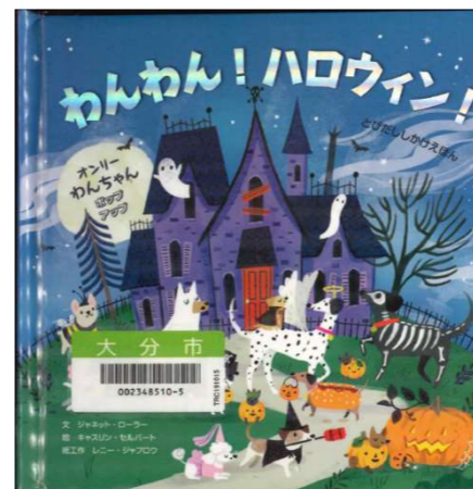
『わんわん! ハロウィン!』 ジャネット・ローラー/文 キャスリン・セルバート/絵 レニー・ジャブロウ/絵工作 〔大日本絵画〕