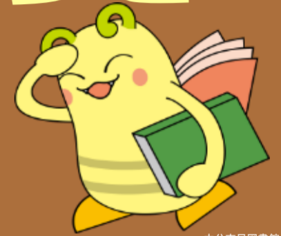
大分市民図書館キャラクター どくしょん