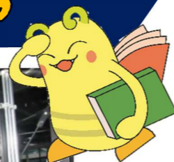
県内唯一のオートライブです！

日時：7月20日(土)、7月27日(土)、8月3日(土)、8月10日(土)、 8月17日(土)、8月24日(土) いずれも土曜日 ・中学生以下：午前11時～ ・高校生以上：午後2時～ 各回30分程度