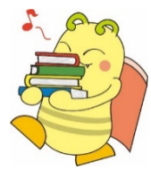
←おおいとしみんとしょかん 大分市民図書館キャラクター 「どくしょん」