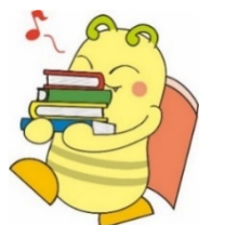
大分市民図書館キャラクター 「どくしょん」