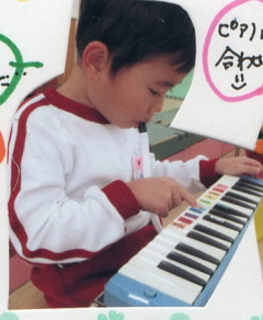
ピアノに 合わせて