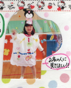
お家の人 に見てほしい!