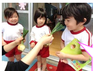
年中児は「タマネギのにおいがする〜！」と切り口の匂いにビックリ