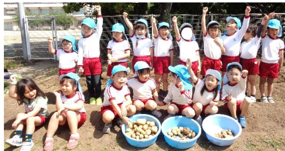
たくさん採れたよ！