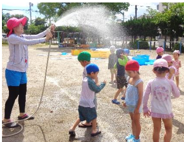
きやあ〜☆ 気持ちいい