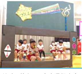
地球の皆さんへ宇宙通信中☆