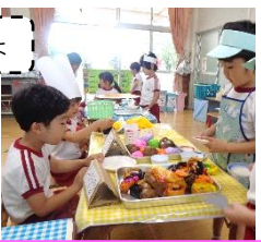
年中さんはお店屋さんごっこが盛り上がりました。