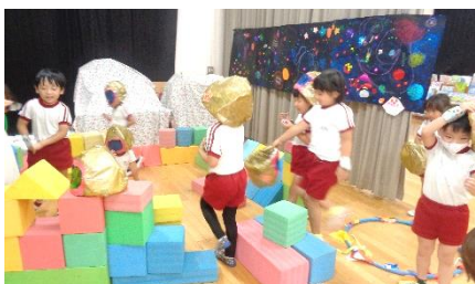
年長さんは、宇宙ごっこでヘルメットや基地など様々な物を作り、遊んでいます。

保育参観でもお知らせしましたが、1学期の間に様々な遊びを通してたくさんの経験をしてきました。4・5歳児での交流も行い、友だちと遊ぶ楽しさを味わいました。幼稚園での生活の仕方が分かり、自分のことを自分で行えるようになりました。この経験を2学期に活かし繋げていきたいと思っています。