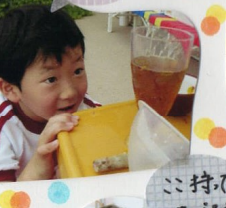
ジュースをいれたい