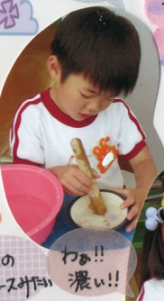
本当のジュースかい わあ!! 濃い!!