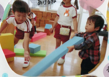
こもってあげるね

月に1回子育て支援事業としてふれあイルームを開催します。園の子とちちは小さい子どもに対する接し方について学んでいます!! 梓幼稚園の参加お待ちしています!!