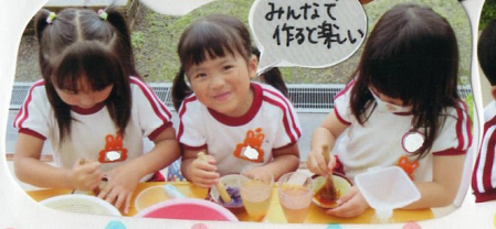
みんなで作るのが楽しい