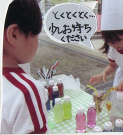
とくとくと... くれお持ちください