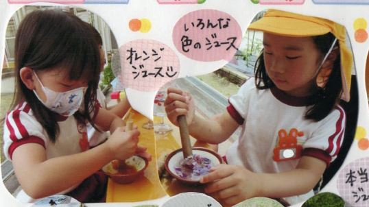
いろんな色のジュース オレンジジュース

花びらや葉、ばと 使って色水を作りました 色が出るには、どうしたらいいかな？水の量はどれ位だろう？濃くするにはどうしよう？など自分たちで試行錯誤したり、友だちから教えてもらったり、教えたりしながら自分たちで考えて作っていました！！何度も繰り返し取組ました。