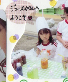
ジュースやさんようこそ♡