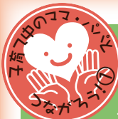
令和元年度「naanaの日交流会」