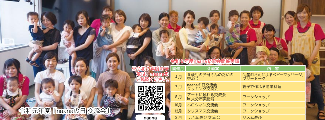
令和6年度naana交流会開催実績

初めての子育てはみんな迷うことばかり。また、転勤等ではじめての土地で行う子育ても、勝手が違ったり友達がなくてさみしいもの。そんな時、市内で子育てしているママ・パパとつながって、情報交換をしたり、仲間づくりをする心強いものです。大分市には、あなたの仲間づくりをサポートするサービスがあります。上手に利用して、あなたに合った方法で友達とつながってみませんか。